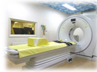
64列マルチスライスCT