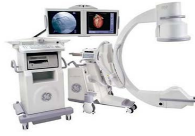
外科用X線撮影装置(Cアーム)