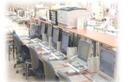
透析情報管理システム

各ベッドには液晶テレビ(地上・BS)・ナースコールを設置しています。室内中央にスタッフテーブルを配置し、室内の隅々まで目が行き届くよう配慮し、患者様が安心して治療を受けられるような環境作りに努めています。