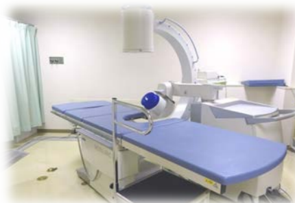
体外衝撃波腎尿管結石破碎装置